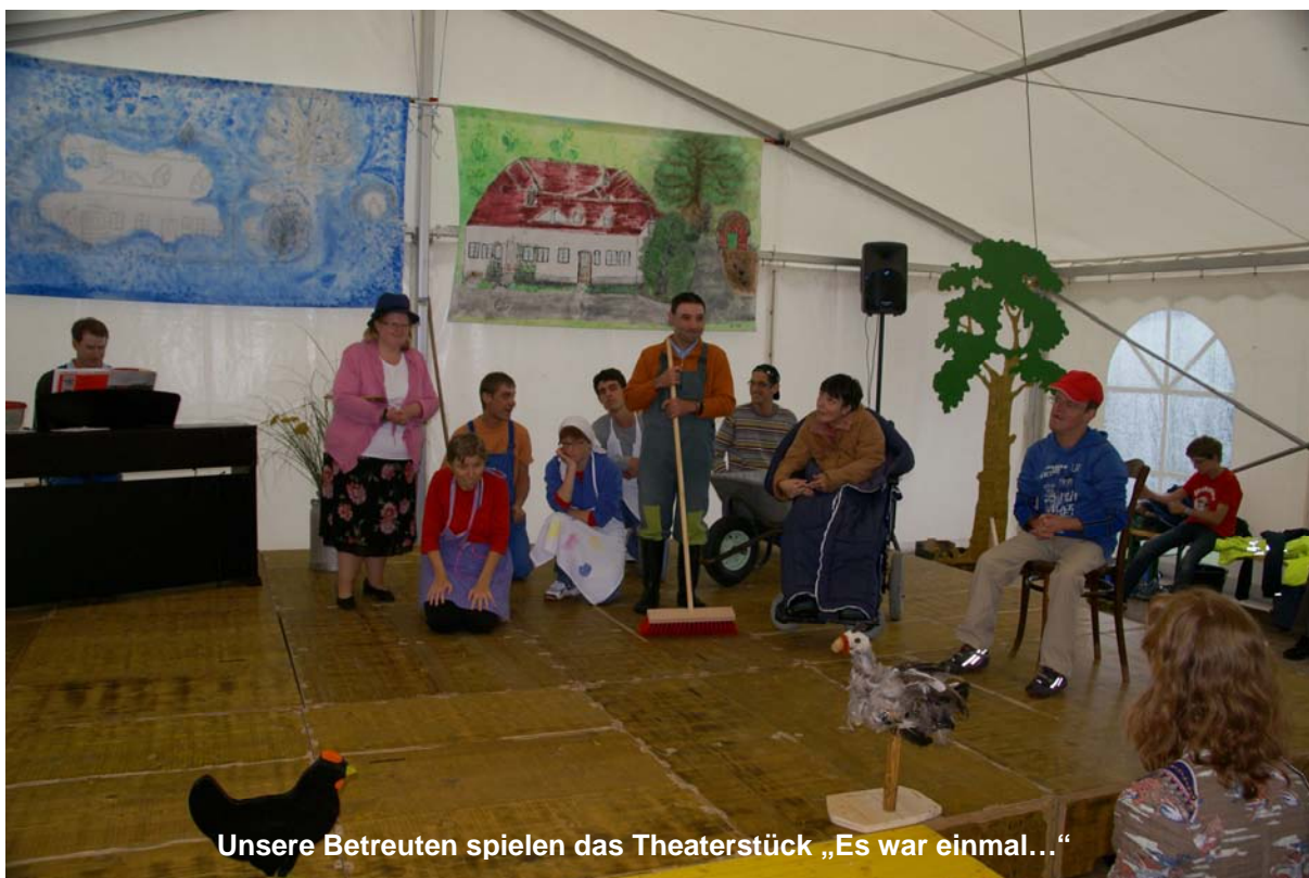
Unsere Betreuten spielen das Theaterstück „Es war einmal...“