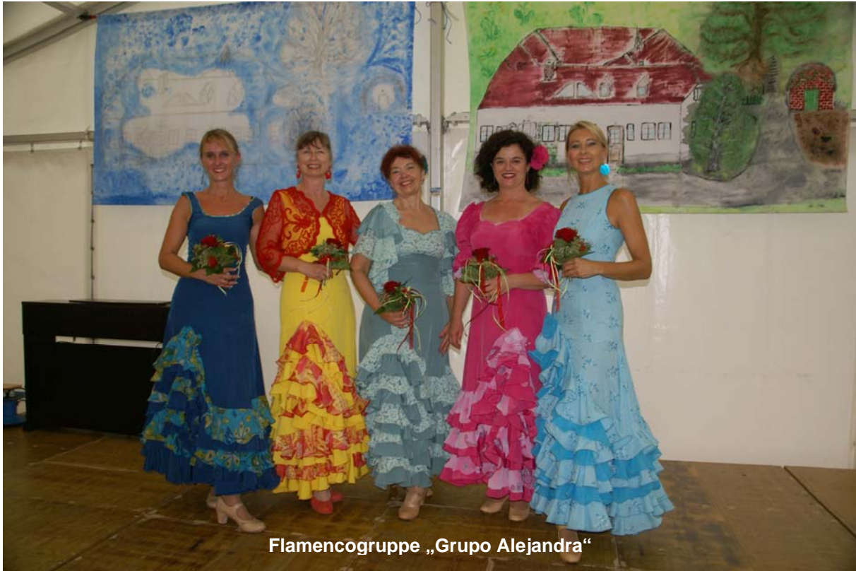
Flamencogruppe „Grupo Alejandra“

Die Flamencogruppe „Grupo Alejandra“ aus dem westlichen Wien boten uns fulminante Darbietungen. Bunte Kleider, rhythmischer Tanz, tolle Choreografie – wir waren begeistert! Mit drei Auftritten und einem ganz neuen Programm konnten die Tänzerinnen das spanische Feeling ins Festzelt holen: