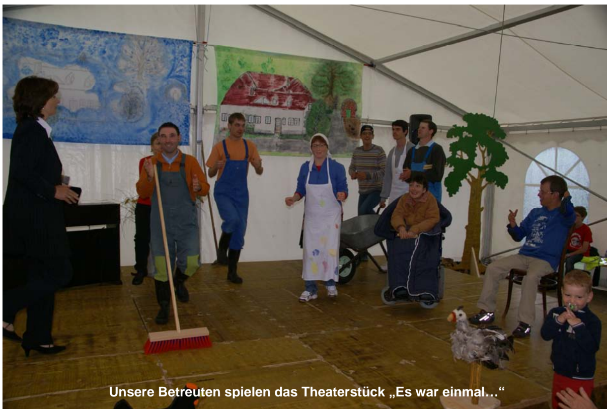
Unsere Betreuten spielen das Theaterstück „Es war einmal...“

Schon die Proben bereiteten uns großen Spaß und diese Freude und der Enthusiasmus sind auch auf das Publikum übergelungen. Auf unserer Homepage www.himmelschluesselhof.net können Sie das Stück als Video sehen.