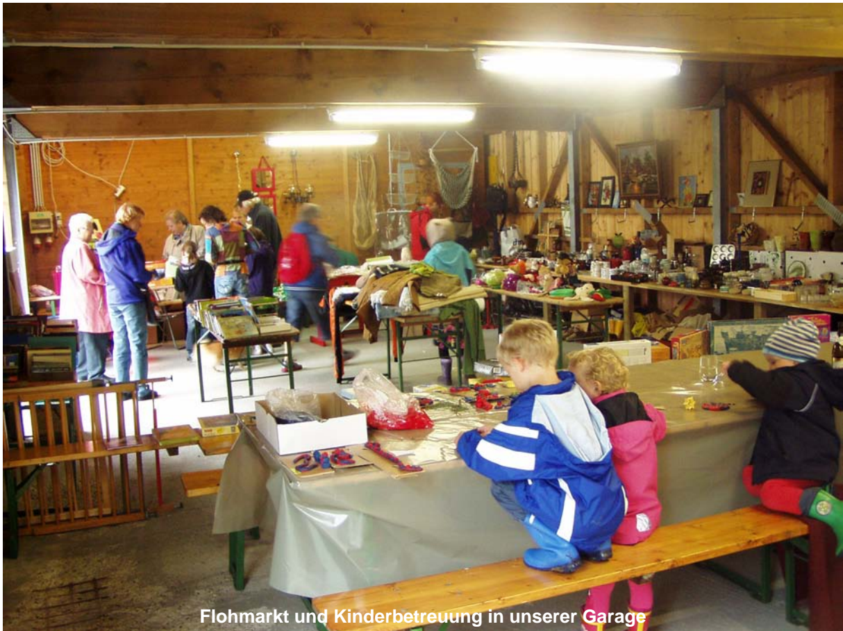
Flohmarkt und Kinderbetreuung in unserer Garage

Ebenfalls in der Garage fand auch die rege besuchte Kinderbetreuung statt. Mit selbstgemachter Knetmasse und kleinen Holzarbeiten waren die Kleinsten gut beschäftigt und unterhalten: