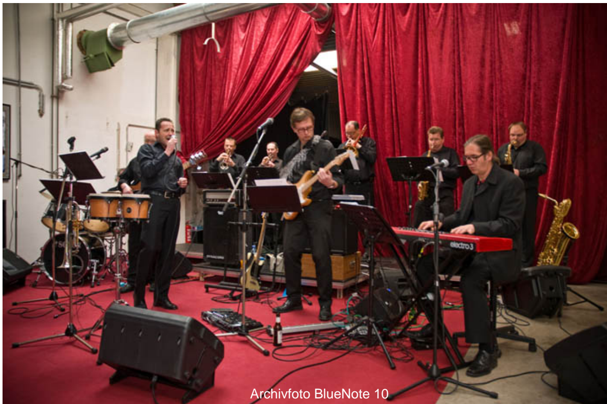
Archivfoto BlueNote 10

Um 17 Uhr stand ein weiteres Highlight auf unsere Festbühne auf dem Plan - von Rhythm & Blues und Soul bis zu Funk und Jazzrock – kaum zu glauben - zehn Musiker (Leadsänger, 2 Saxophone, 2 Trompeten, Posaune, Keyboard, Gitarre, Bass, Schlagwerk) forderten uns mit ihrer mitreißenden Musik zum Tanzen auf! - BlueNote10, eine Gruppe aus der Region St.Pölten und Umgebung – die haben wirklich was los!